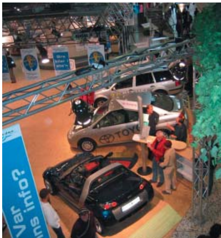
Toyota Prius fanns på mässan. En ny Prius kommer snart, den har 15 procent lägre bränsleförbrukning och högre effekt.