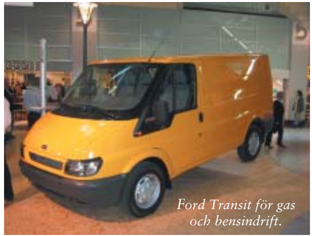
Ford Transit för gas och bensindrift.