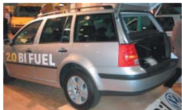
Golfen har gastankarna i ett utrymme under det något upphöjda golvet i bagageutrymmet.