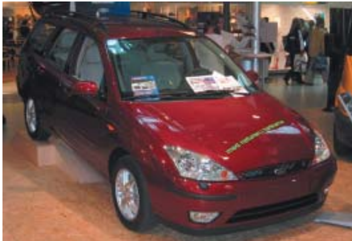
Ford Focus Flexifuel för etanol och bensindrift. Åtta av tio Ford Focus som säljs är etanoldrivna.