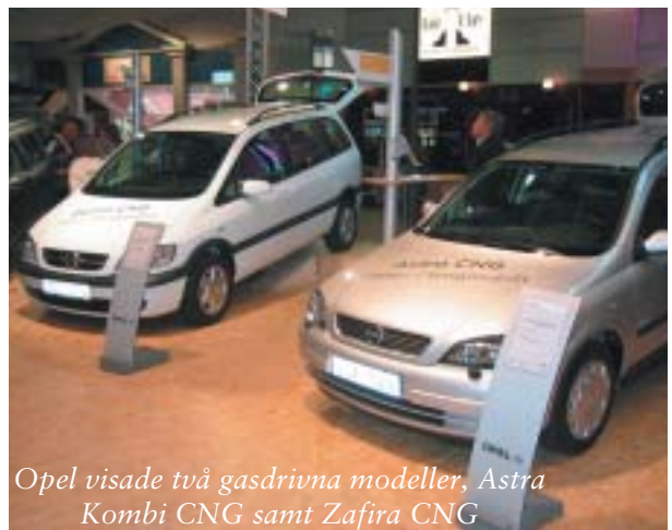
Opel visade två gasdrivna modeller, Astra Kombi CNG samt Zafira CNG

ordstan hade Miljöfordon i Göteborg samlat alla ty- fordon som finns att köpa på den svenska markna- arrangerades i september i samband med den Eu- fria dagen, i Göteborg kallad "i stan utan bil". Cirka i Europa gör sina stadskärnor bilfria under en dag.