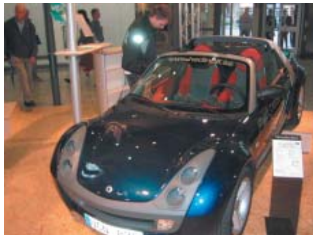
En mycket bensinsnål modell från Smart.