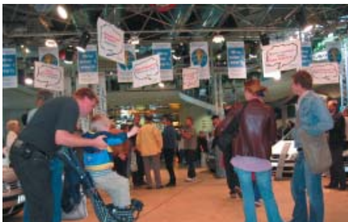
Fler än 70 000 personer passerar Nordstan varje dag, några av dem fick en unik insyn i utbudet av miljöbilar.