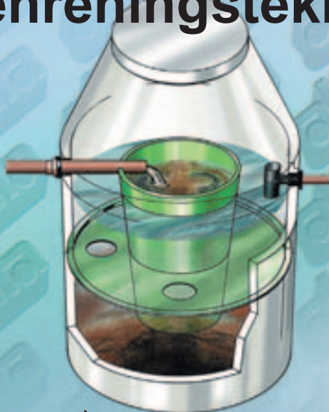
▲ BAGA patenterade slamavskiljare med exceptionell hög avskiljningsförmåga