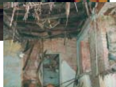
Det inrasade källartaket

Ovolin har tillverkning och butik i en antikvariskt renoverad industrilokal inne på de äldsta delarna av Degerfors Jernverk.