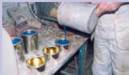
Efter en stunds blandning är färgen klar att hällas upp på burkar