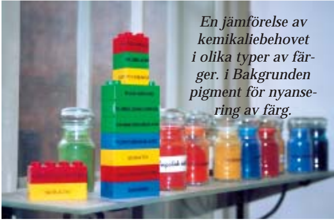
En jämförelse av kemikaliebehovet i olika typer av färger. i Bakgrunden pigment för nyansering av färg.