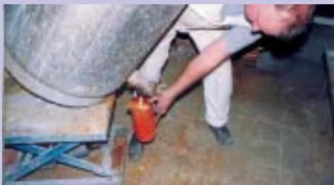
Blandning av äggpulver och linolja mäts upp och hälls i behållaren