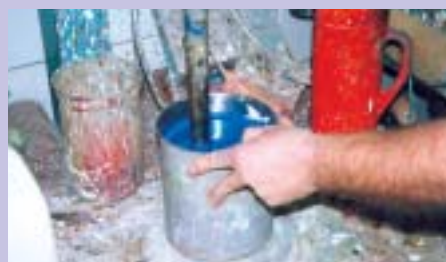
Pigmenten blandas ner i en behållare med vatten