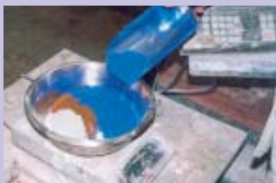
Först vägs pigment på väg.