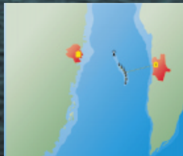
Utgrunden ligger mellan Öland och fastlandet i Kalmarsund