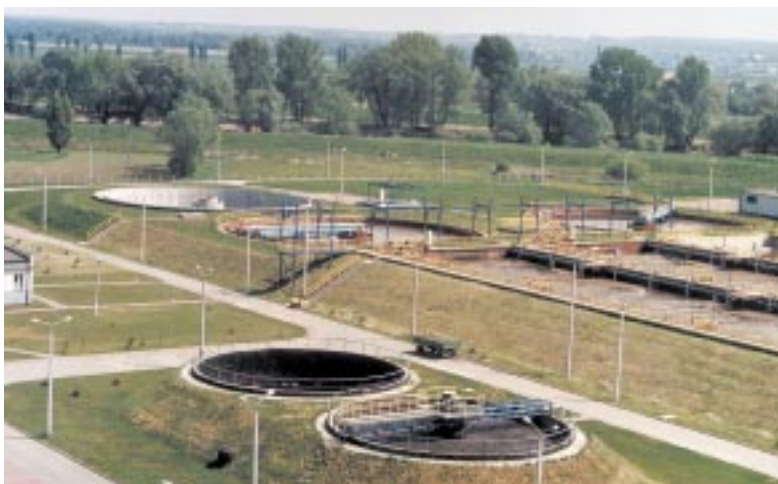
Det nya reningsverket, bakom basängerna syns floden Oder och dammen som brast för tre år sedan. Idag håller man på att höja dammen med minst en meter.