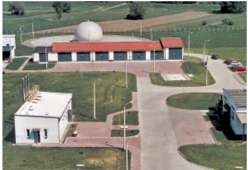
Anläggningen som utvinner biogas vid det nya reningsverket i Raciborz. Gasen utvinnas ur avloppsvattnet och lagras i den runda behållaren, också en nyhet på dessa breddgrader.

Under senare tid har även behovet av dricksvatten sjunkit och det i sin tur har lett till höjning av grundvattennivån. Det