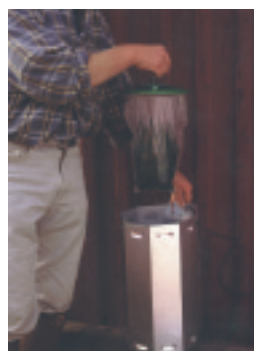
Flugfångare för utomhusbruk aktiveras genom solstrålarna. För inomhusbruk aktiveras flugbetet med av lysrör.