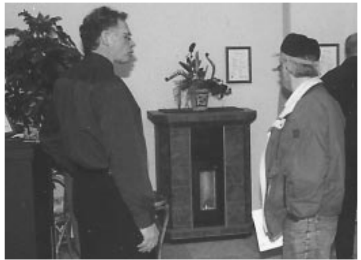
Kaminen visades för första gången vid Nolia's mässa Fem rum och kök, som genomfördes i slutet av oktober.