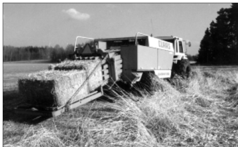
Rörflenet skördas och packas i balar.

Rörflen får växa ostörd under hela växtperioden. Den lämnas kvar på rot över vintern och skördas först följande vår.