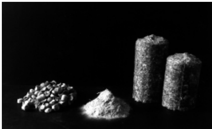
Pellets, pulver och briketter gjorda av rörflen som råvara.

Norrland gynnat. Produktionsförutsättningarna för energigräs är i dagsläget sär-