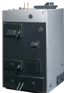
Thermia Biomix Dubbelpanna för pellets, ved, olja alt. el.