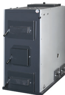
Thermia Effectic Miljögodkänd självdragspanna för ved, pellets alt. olja. 25 och 45 kW. Flisuttag höger/vänster.