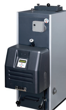
Thermia Bionet Pelletspanna för dockning till befintlig panna, värmepump eller solvärmesystem. 12 kW.