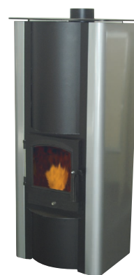
Thermia Soft Pelletskamin med inbyggd brännare. 5 kW. Externt pelletsförråd.