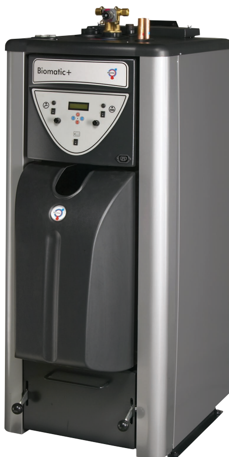
Thermia Biomatic+ Pelletspanna med inbyggd brännare. 20 och 50 kW.

För mer information kontakta din Thermia återförsäljare