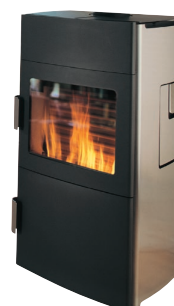
Thermia HWAM Elements Unikt ljudlös pelletskamin. 6 kW. Självdrag utan eltillförsel.