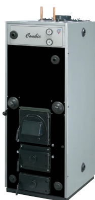
Thermia Combic Kombinationspanna för pellets, ved, el alt. olja.

För mer information kontakta din Thermia återförsäljare