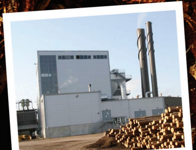
Finnforest, Finland 2,9 MWe/ 13,5 MWth

Sex goda skäl att tro oss då vi säger att vi kan