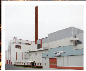
Marks Värme, Sverige 3,5 MWe/ 16 MWth