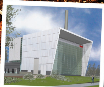
Trollhättan Energi, Sverige 3,6 MWe/ 17 MWth (överlätes 2006)

bygga Er ett bibränsleeldat kraftvärmeverk.