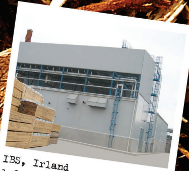
IBS, Irland 1,8 MWe/ 3,5 MWth

Sex goda skäl att tro oss då vi säger att vi kan