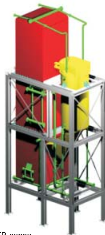
Ny FB-panna speciellt utvecklad för avfallseldning i små och medelstora tillämpningar.