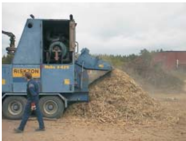
Återvunna träbränslen, utsorterat papperers- och plastavfall blir skön fjärrvärme i Kil.

TPS bygger pannor med EU-anpassad teknik optimerad för mindre anläggningar