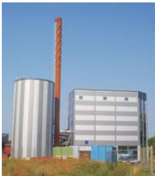
Fjärrvärmecentral 8 MW för utsorterat avfall i Kil i Värmland.