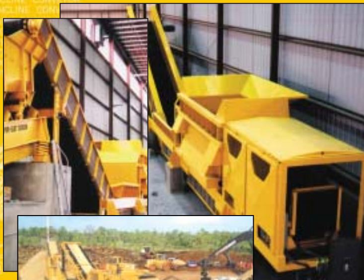
CBI 4800 Magnum Force

Med CBI 4800 Magnum Force kan du i samma maskin byta mellan hugg- och krossrotor.