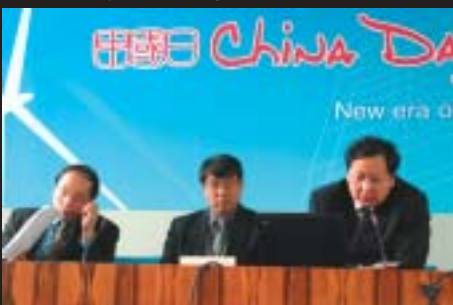
Kina lanserade sitt program för förnybar energi på en välbesökt sidokonferens.