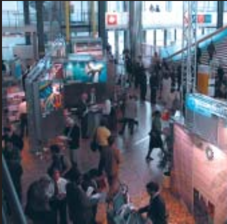
Ett stort antal organisationer och länder fanns på plats med monstrar, dock ej Sverige.