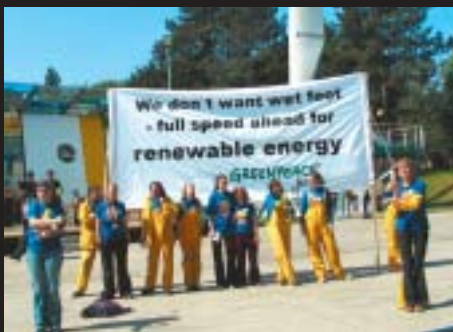
Greenpeace ungdomar peppade konferensdeltagarna hela tiden.