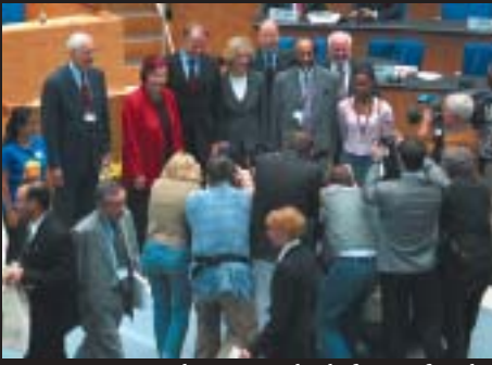
Ett imponerande pressuppbåd, fotograferade bland andra Miljöminister Trittin