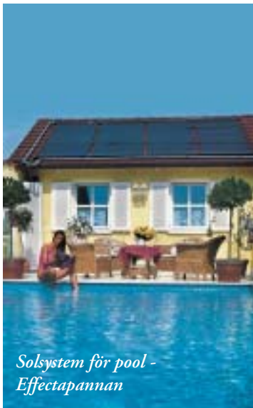
Solsystem för pool - Effectapannan

Bioenergi presenterar här några av de solsystem som finns på marknaden idag. Enkäter har skickats ut till ungefär tjugo berörda företag, nedan publiceras de svar vi fått in, översikten skall sedan varje år uppdateras och förnyas precis som vår stora pelletsbrännarguide. Tekniska frågor kring systemen hänvisas till respektive företag.