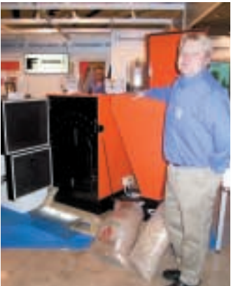
Värmeprodukter visar ny italiensk pellets- och spannmålspanna

nor med omvänd förbränning, keramisk eldstad och självdrag, i storlekarna 30, 40 och 50 kW. Särskilt vill man framhålla den utrymmesnäla panna och ackumulatortankpaketet på 2 * 750 liter som endast upptar bredden 2,15 meter.