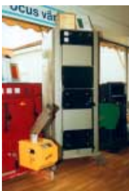
Två pannor från Focus Värme med EcoTec och PellX som sällskap.