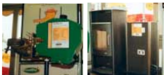
Sablins EcoTec visade upp både brännare och kamin med stort engagemang som vanligt.

På utställningen utomhus fanns även: Roslagsbrännaren, Narvell, Janfire & Baxi representerade.