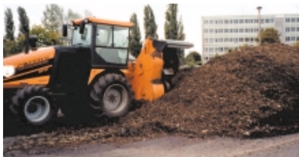
Grizzly DT 32/DU 320 Sexcylindrig turbodiesel motor på 235 kW redo att sättas i arbete!