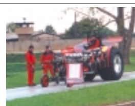
För den stressade bonden – en dragster!! T.v och nedan: Studiebesöksgruppen under ledning av OP Maskiner besöker kurorten Bad Salzelmen där salt utvinns ur underjordisk källa och anses ha positiva hälsoeffekter!