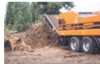
AK 430 PROFI Mobil flisningmaskin monterad på dubbelaxel chassi som får transporteras i 80km/h. Dieselmotor från MB på 315 kW vid 2000 rpm och 2000 Nm vridmoment vid 1080 rpm.