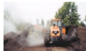
"Kompostvändaren" DU 320. Kapacitet över 1.000 m 3 /h.

I flera andra länder, representeras man av återförsäljare i Sveriges fall OP Maskiner AB.