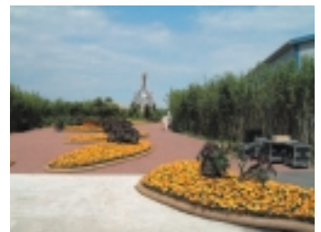
På bomässan i Malmö Bo01 har man utnyttjat Salixodlingens estetiska fördelar. Salixskogen utgör en tredjedel av mässområdet. Här på prinsessan Viktorias blomstergata med kronan av Salix i centrum.

En vanlig Salixodlare får flisintäkt, arealstöd på omkring 2.300 kr per år (som alla andra grödor) och anläggningsstöd på 5.000 kr vid planteringen. Eftersom många kommuner och markägare arrenderar ut mark för 500-1500 kr per hektar, blir Salixodlingen ett av de bästa alternativen. För kommuner som kan gödsla odlingen med rötslam istället för att lägga slam på depони, blir den årliga intäkten omkring 3.500 kr per hektar. Detta är klart mer än vad man får in som arrende och samtidigt löser man slamproblemet.