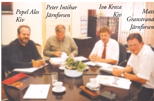
Pepel Ales Kiv