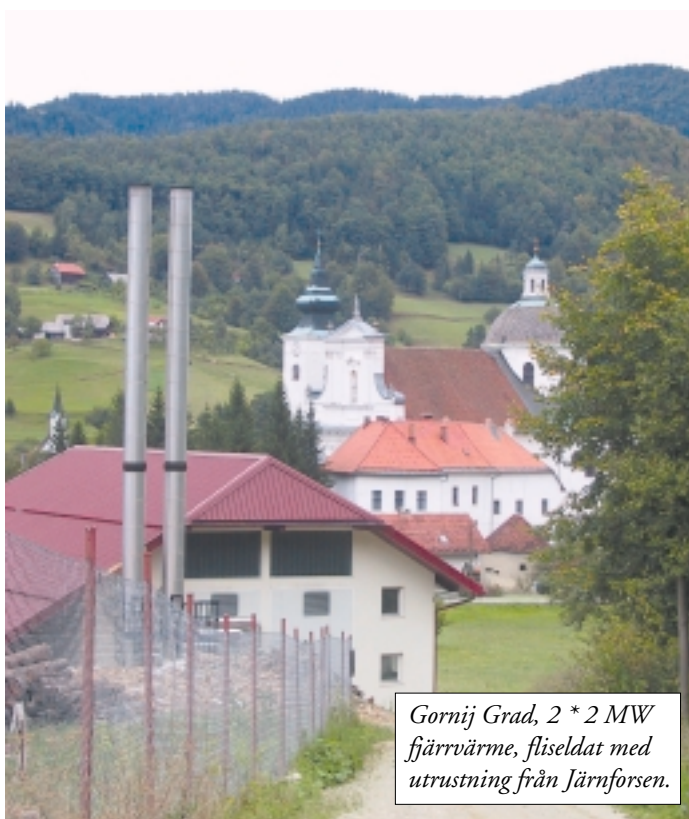
Gornij Grad, 2 * 2 MW fjärrvärme, fliseldat med utrustning från Järnforsen.

Gjutning sker hos Feniks ett numer belgiskt ägt företag lokaliserat endast 20 km från monteringen hos Kiv.