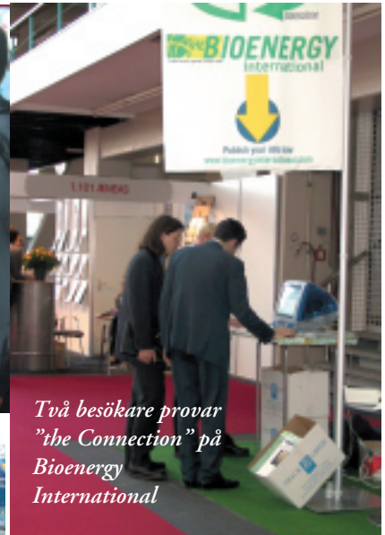
Två besökare provar "the Connection" på Bioenergy International