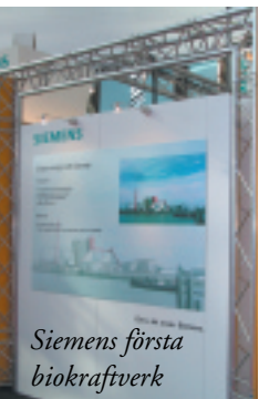
Siemens första biokraftverk