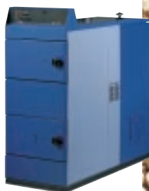
MULTI-HEAT Den kompletta pelletspannan

Vi har värmepannor för alla behov. Vedpannor, pelletspannor och olje- pannor, i olika storlekar och utföranden. Det som förenar dem är funktion och kvalitet. En HS- Perifalpanna ger dig både värme och trygghet. Länge.