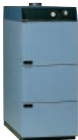
SOLO INNOVA Den fulländade vedpannan

Vi har värmepannor för alla behov. Vedpannor, pelletspannor och olje- pannor, i olika storlekar och utföranden. Det som förenar dem är funktion och kvalitet. En HS- Perifalpanna ger dig både värme och trygghet. Länge.